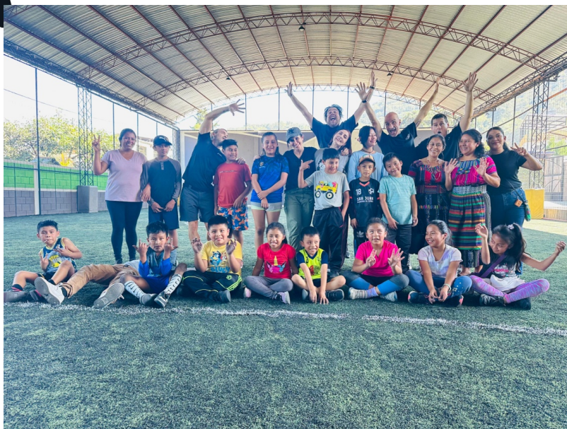
Aquí, en casa Aqabal con el equipo que protege y lucha por las mujeres supervivientes de violencia de género.