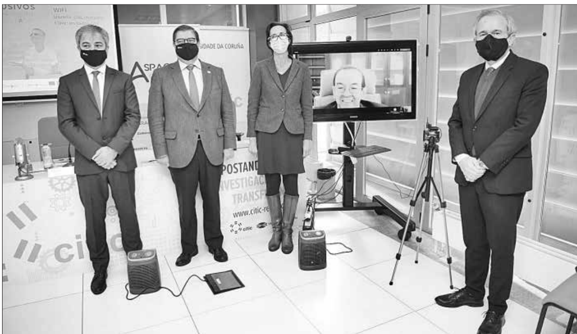
Presentación del programa de la Universidad 'Talentos Inclusivos'. // L.O.

¿El resultado? "Una gran sonrisa", dicen los miembros de esta asociación, que también tiene minimercadillos en Mesoiro en los que se cumplen las medidas de seguridad por el coronavirus.